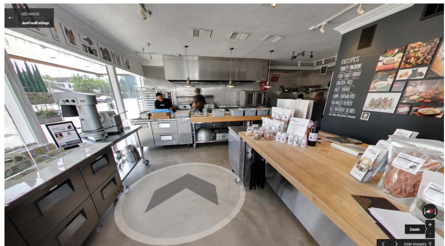
Image Business View de la cuisine ouverte de Just Food For Dogs, à Newport Beach (Californie)

Rudy Poe, gérant associé, Just Food For Dogs