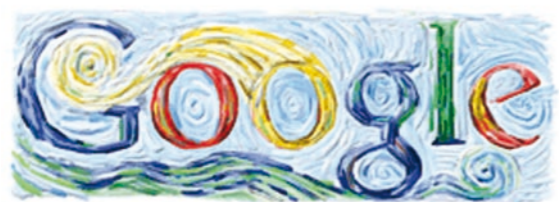
De verjaardag van Van Gogh