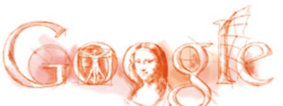
Geboortedag van Leonardo da Vinci