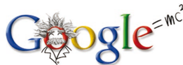
De geboortedag van Einstein