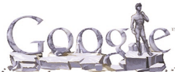
De geboortedag van Michelangelo