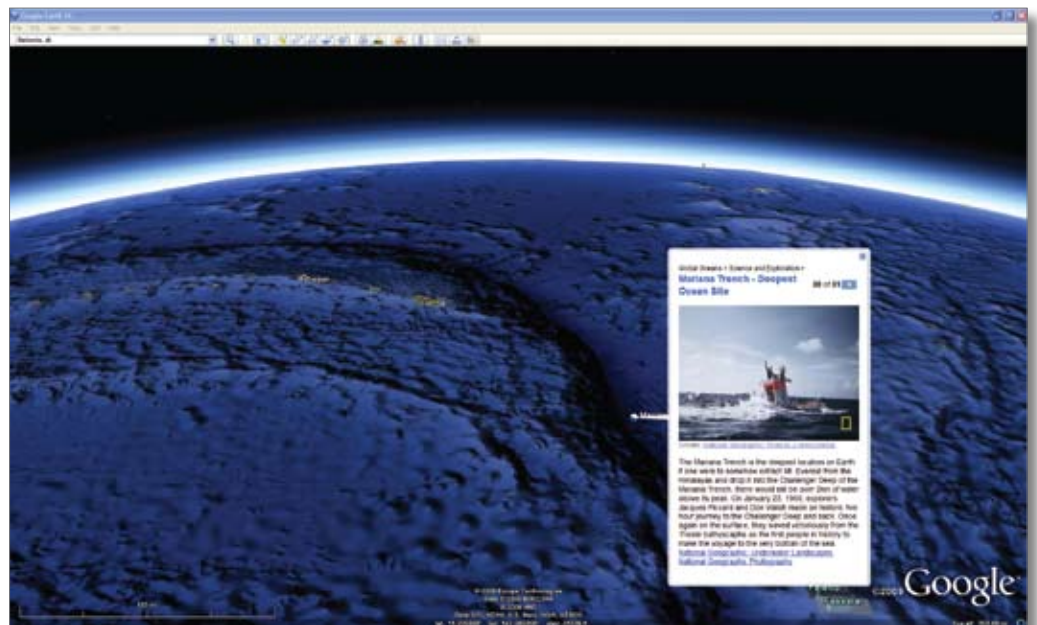
Figura 2: Coloque os dados da sua empresa sobre a terra (e agora também sobre o fundo do mar), como visto nesta imagem do Marianas Trench.

Vá mais além do Earth Além do Earth, o Google permite agora aos usuários visualizar dados sobre os Oceanos, e até mesmo a Lua e Marte. O Google Earth também lhe permite “voltar no tempo” com a habilidade de visualizar imagens históricas. Compará-las com as visualizações atuais ajuda os empregados a entender rapidamente como um lugar ou região evoluiu ao longo do tempo.