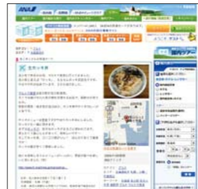
「旅達空間 コミュニティサイト」

確固たる安定性やセキュリティ等に企業メリットを感じ、コストに見合うものだと考えた