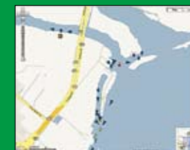
「Port Vision 車両トラッキング」

海運業では、商船の運行状況や活動情報の監視、把握に対するニーズが高まっている。Port Visionは、Google Maps API Premierおよび洗練されたロジック変換位置信号により、ユーザーフレンドリーなマップとアニメーションを介して追跡データと活動データをリアルタイムで提供している。