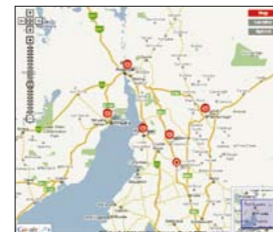
「REA Group 不動産検索」

年間15億に達する物件地図を提供する、世界有数の地図プロバイダにもなった不動産検索Web